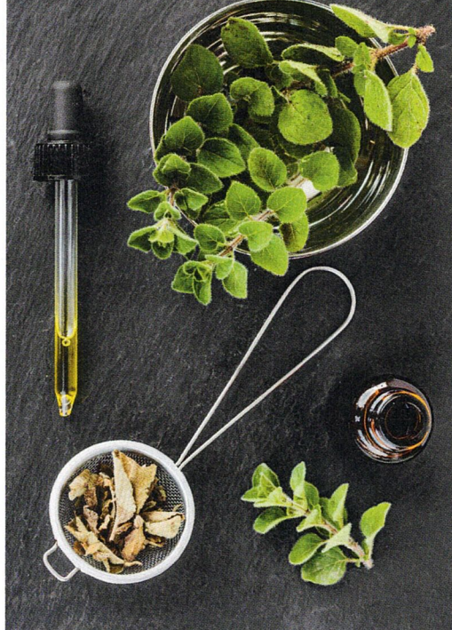
Aus dem Oregano wird eines der potentesten ätherischen Öle gewonnen