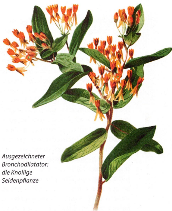
Ausgezeichneter Bronchodilatator: die Knollige Seidenpflanze

Wir werden uns wundern, dass die sozialen Verzicht, die wir leisten mussten, selten zu Vereinigung führten. Im Gegenteil. Nach einer ersten Schockstarre würden sich viele von ihnen sogar erleichtert fühlen, dass das viele Rennen, Reden, Kommunizieren auf Multikanälen plötzlich zu einem Halt kam. Verzicht müssen nicht unbedingt Verluste bedeuten, sondern können sogar neue Möglichkeitsräume eröffnen. Das hat schon mancher erlebt, der z. B. Intervallfasten probierte – und dem plötzlich das Essen wieder schmeckte. Paradoxerweise erzeugte die körperliche Distanz, die das Virus erzwang, gleichzeitig neue Nähe. Wir haben Menschen kennengelernt, die wir sonst nie kennengelernt hätten. Wir haben alte Freunde wieder häufiger kontaktiert, Bindungen verstärkt, die lose und locker geworden waren. Familien, Nachbarn, Freunde sind näher gerückt und haben bisweilen sogar verborgene Konflikte gelöst.“ Die Corona-Krise könnte eine Chance sein, in einer überhitzten, zu schnellen Welt durch vorübergehenden Stillstand des gesellschaftlichen und wirtschaftlichen Lebens sowie durch kreative Lösungen und Flexibilität zu einem neuen Anfang des Zusammenlebens zu kommen.