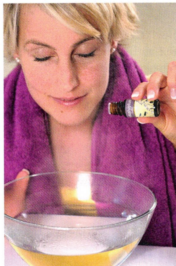
Einfach und sehr wirksam: die antiinfektiöse Kraft der ätherischen Öle einatmen

Holunderbeerensaft enthält neben Vitamin C viele wertvolle Flavonoide und bestimmte Anthocyane, eine Gruppe von Phenolen, die